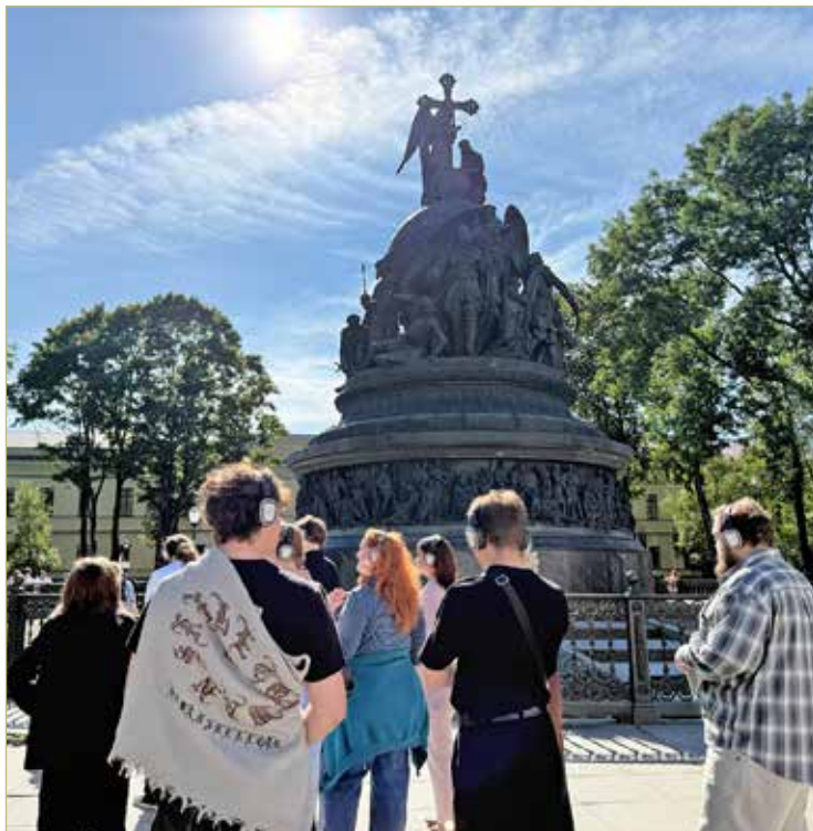
Во время аудиоэкскурсии участники успевают осмотреть памятник со всех сторон.

Несмотря на то, что аудиоспектакль посвящён памятнику,