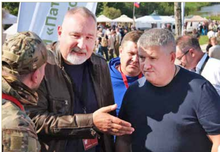
Глава региона Александр Дронов осматривает выставку разработок «народного военно-промышленного комплекса» вместе с сенатором Российской Федерации Дмитрием Rogozinym.