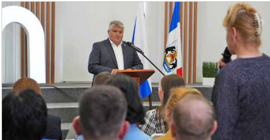
Врио губернатора Александр Дронов на встрече с жителями Великого Новгорода.

Александр ДРОНОВ: У нас есть проект «Новгородская медсестра». Наряду с проектом «Новгородский врач», он призван повысить уважение к медицинским специалистам. И в том числе поддерживать их материально. Также напомним, что часть чудовских педагогов получает доплату в 5 тысяч рублей. В наших планах — её увеличить. Ещё одна задача — создание комфортных рабочих мест. Один из