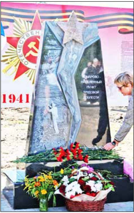
Мемориал будет напоминать о трудовом подвиге жителей Комарова и всей страны.

А между тем во время Великой Отечественной войны в Комарово прибывали люди из разных уголков страны. В трудовом подвиге приняли участие группа корейцев из Каракалпакской АССР, донбассовцы. Размещали приезжих в палатках, крестьянских домах, бараках.