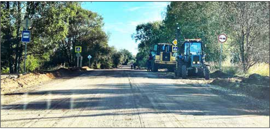
Ремонт 64-километрового участка А122 планируют закончить в 2026 году.

— Это не просто дорога — это наша основная жизненная артерия, — говорит глава Марёвского округа Сергей ГОРКИН. — Она связывает важные населённые пункты и является транспортным