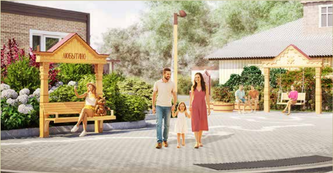
Обновлённая Базарная улица станет живым учебником любытинской истории. Визуализация проекта ЦРГСНО