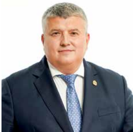
ДРОНОВ АЛЕКСАНДР ВАЛЕНТИНОВИЧ, КАНДИДАТ НА ДОЛЖНОСТЬ ГУБЕРНАТОРА НОВГОРОДСКОЙ ОБЛАСТИ